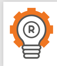
Marque Dessin & Modèle

Aucun prérequis n'est nécessaire pour suivre cette formation. Temps de formation (4h)